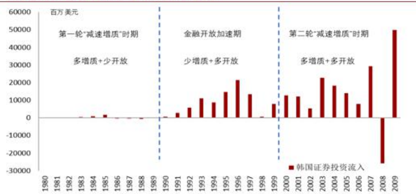
“金融开放+经济增质”对国际资本形成强劲吸引力

“增质”红利的结构性机遇将保有相对确定的优势，值得长期布局深耕。第二，关注短期退潮中的多样性机会。从短期来看，在全球地缘政治冲突阶段性缓和之前，国际资本或将继续逃离高风险的权益类资产，并有望带来两种短期机会。一是市场恐惧情绪极端化所导致的权益类资产定价扭曲，若能及时捕捉，则有望在涨潮时有所收获。二是在“错峰效应”下，国际资本可能转而通过债市等其他途径进入中国，以相对安全地分享“增质”红利，进而带动相应市场的格局变化。第三，管理好预期调整中的流动性风险。在短期退潮和长期涨潮之间，市场情绪将敏感而多变，并牵动市场流动性的大幅涨落。因此，审慎管理好流动性风险，将是在这一时期渡过险滩的必要举措。