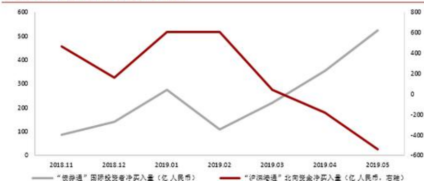
多渠道的金融开放对外部冲击形成“错峰效应”