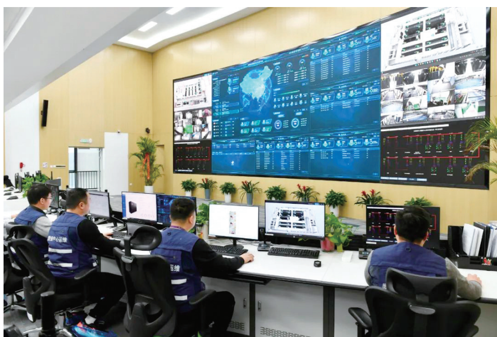
合肥城市云数据中心IDC运营中心

轻资产、少抵押、高成长、高风险……这些都是影响科创企业获得与其核心竞争力相匹配资金支持“绊脚石”。 相对于大型企业、成熟企业,中小及初创型科创企业更需要金融组织放目光、耐下性子,与其共同成长。 合肥市云数据中心股份有限公司(以下简称:合肥城市云)自2012年成立以来,深耕产业数字化转型云服务领域,为政府及行业客户提供“云计算+服务+数据”的混合云计算业务。 然而,作为科技型企业,合肥城市云的融资之路并非一帆风顺。 融资初期,合肥城市云发展主要依靠传统方式,但由于每年都有大量的研发投入,企业时常周转资金不足,融资难、融资贵的问题,制约着企业的发展。 机会常常是留给有准备的人。多年来,该企业十分重视技术研发和知识产权保护工作,近三年每年投入千万余元用于技术研究和产品研发,因此也积累“大量”的专利。