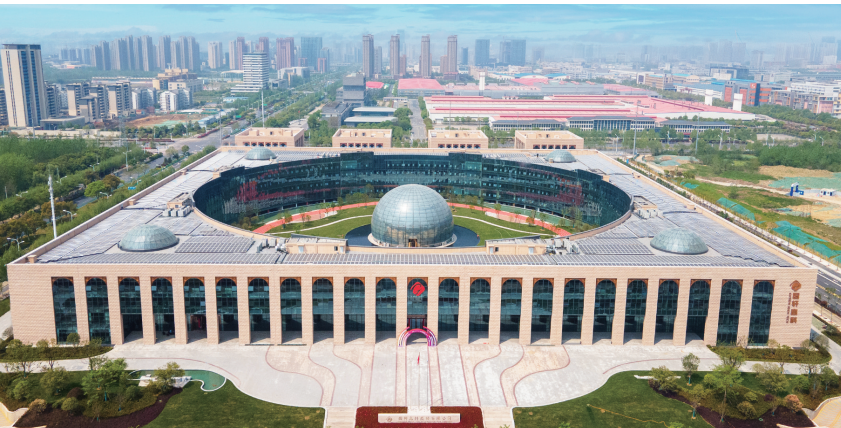
国轩高科工程研究院总院

作为推动产融结合的重要方式,供应链金融是指运用金融科技手段,整合资金流、产销信息流等,构建核心企业与上下游企业一体化的金融供给体系,在帮助企业纾困和赋能产业链发展等方面开始发挥越来越重要的作用。 深化供应链金融发展,“核心企业”要唱好主角,“金融活水”要精准浇灌。 作为纳入全省首批监管“白名单”的4家商业保理公司之一,近年来,兴泰保理根据合肥市重点产业链科创型企业差异化融资需求,创新推出了合肥市首个科创型企业供应链财