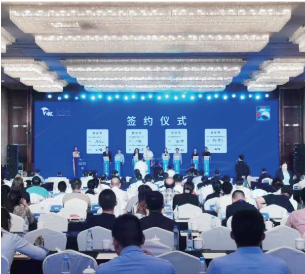
2023年供应链金融发展大会签约仪式

9月21日下午,2023世界制造业大会重要专题活动——2023年供应链金融发展大会在合肥举办。 在合作签约环节,多家金融机构代表与合肥市重点供应链企业成功签约。兴泰控股旗下兴泰保理作为唯一的商业保理机构代表,与国轩高科股份有限公司(以下简称:国轩高科)签订合作协议,合作金额为1.5亿元。后续,兴泰保理将通过“保理+产业链”模式,为国轩高科提供保理融资、坏账担保等“一揽子”定制化金融服务。 事实上,作为“老朋友”,兴泰控股与国轩高科的合作要从2015年说起。 那一年,兴泰租赁与国轩高科成功合作“新能源电池组”融资租赁项目,支持合肥公交集团购置360台纯电动汽车,开创了合肥市在新能源汽车示范推广过程中一种新型商业模式。 动力电池属于新能源汽车产业链中游,上游有原材料,下游有整车制造及服务。截至2023年8月,在上述特色产品中,制造业企业保金额超5000万元,本年新增金额超3400万元。 除了供给多元化的金融产品,兴泰担保还全面下调担保费率,降低小微企业融资成本。目前,兴泰担保针对小微企业客户担保费率均不高于1%,其中“政信贷”产品业务费率仅0.5%。“创业贷”等产品更是免收担保费。