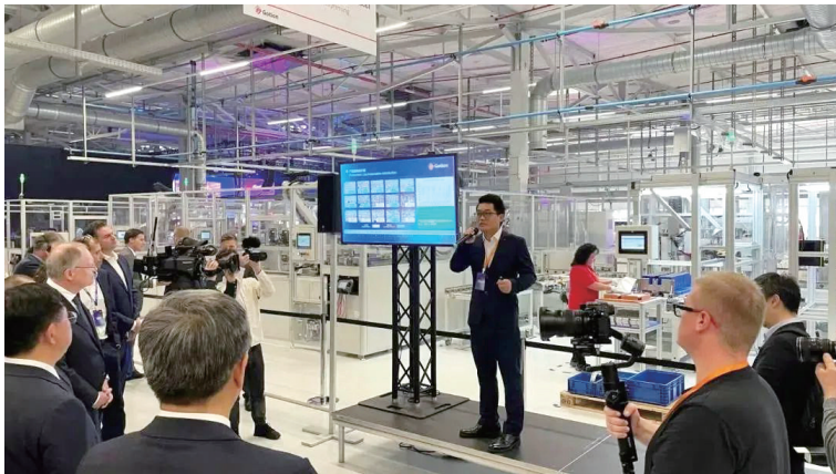
国轩高科德国工厂首条电池产线

技术与资本相结合,才能催生科创引擎的澎湃动力。 近年来,合肥市发挥国有资本引领作用,撬动优质社会资本参与,围绕地方重点产业布局子基金,形成总规模超千亿元的基金丛林,有效培育壮大了一批在新兴产业中具有广阔发展前景的企业。 于是,有媒体将产业基金运作的“合肥模式”总结为:铺好产业赛道,用好产业基金,把“每一笔投资用到最需要的地方”。 作为兴泰控股着力打造区域性、专业化基金运营和股权投资平台,兴泰资本自2014年设立以来,坚持母基金管理和项目投资“双轮驱动”,引资源、聚要素,与国家级基金、产业资本、投资机构合作设立参股基金,为合肥“智造”持续赋能。截至目前,兴泰资本以直接和间接参股方式合计设立基金63只,已形成总规模近720亿元的基金集群,助力合肥市重点产业“建圈强链”。 据统计,“兴泰系”基金累计投资项目460多个,投资额约190亿元,其中合肥项目投资数量及金额占比均超40%,通过基金集群已助推38家企业成功上市,其中合肥项目14家。 载下“梧桐树”,引来“金凤凰”。在服务