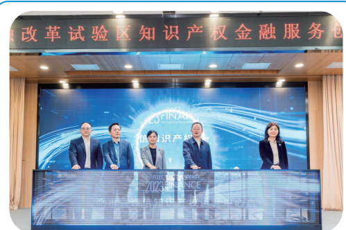
合肥市兴净信知识产权运营中心签约现场