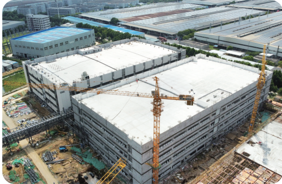
合肥联创正在建设的厂房

这并非个例。兴泰资本多年来围绕合肥市“16+N”条重点产业链,招大引强,成功推动了河北金力隔膜项目、江苏超电快充电池项目、第三代化合物半导体项目等90个优质产业项目串珠成链、签约总投资额约