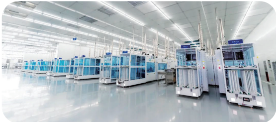
大恒能源TOP con智造基地

“投贷联动”是兴泰资本基于母公司兴泰控股旗下丰富的金融业态推出的特色打法,综合运用管理的合肥市首支投担联动基金、合肥市首支投租联动基金等,全面拓展服务范围,为科创企业提供全周期跟进式服务、全链条专业化服务、全方位降本服务。