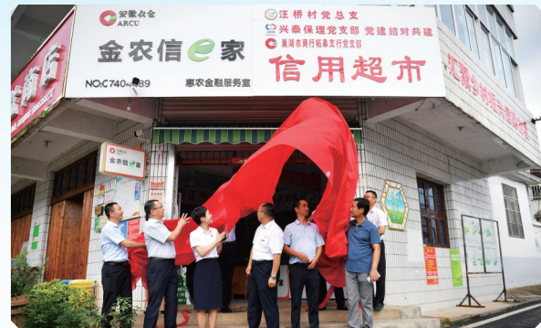
建成全省首家党建结对共建“信用超市”