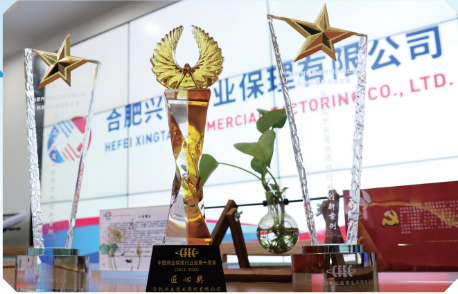
兴泰保理荣获全国商业保理专委会颁发的“匠心奖”