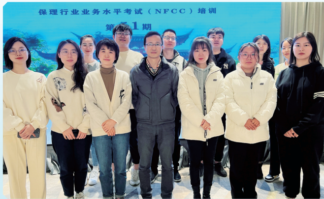
全员通过全国保理行业业务水平考试

党建引领赋能乡村振兴。通过党建共建形式，兴泰保理与多个乡村建立常态化帮扶机制，为肥东县牌坊回族满族乡农村留守儿童送上学习用品和慰问金，与汪桥村建成全省首家党建结对共建的“信用超市”，党建引领信用村建设取得重要成果。扶贫先扶智，兴泰保理先后两次参与捐书助学活动，精心挑选600册图书捐赠给寿县家庭经济困难的中小學生，以实际行动支持寿县推进脱贫攻坚工作；为霍邱县高塘镇捐赠310册图书，助力乡镇图书馆建设。