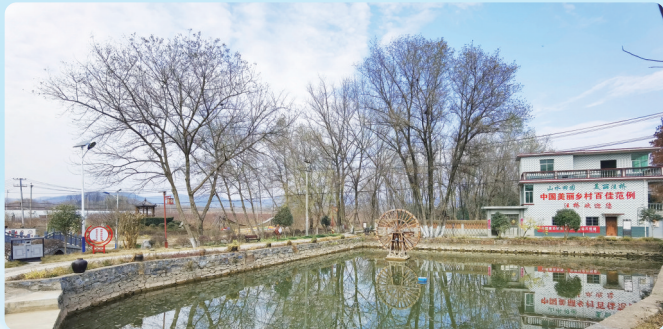
美丽汪桥,百佳范例

日有所思,夜有所梦。但愿今夜的梦里,瓜蒌更加美丽。(首发《合肥晚报·巢湖晨刊》2021年12月13日7版望湖亭副刊;中国作家网2021年12月18日转载)