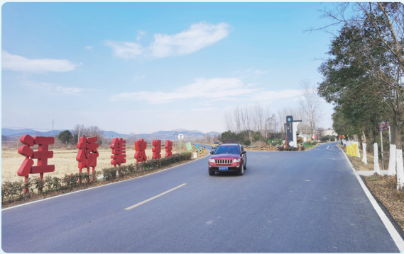
走进汪桥,风景如画